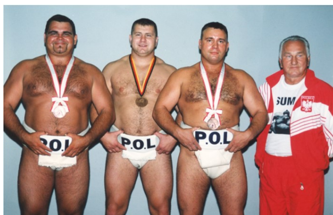
1999 - drużynowi wicemistrzowie świata w sumo