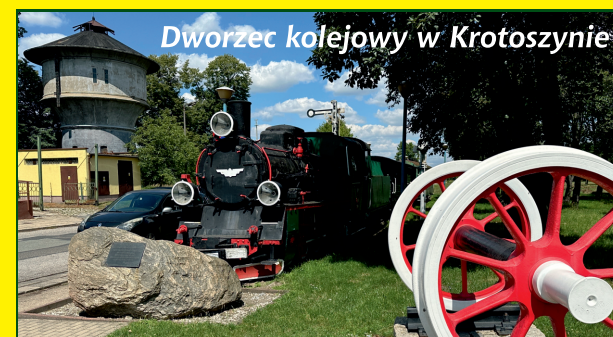
Dworzec kolejowy w Krotoszynie

Szlak rozpoczyna się na placu przed dworcem kolejowym, skąd udajemy się ukośną alejką do ul. Fabrycznej, następnie w prawo do ul. Mickiewicza, na niej skręcamy w lewo i za chwilę w prawo w ul. Sienkiewicza, którą docieramy do ul. Piastowskiej, skręcamy w lewo i za kilkaset metrów znowu w lewo w ul. Floriańską.