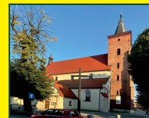
Bazylika pw. św. Jana Chr.

Przecinamy szosę do Sulmierzyc (3,7 km) i wchodzimy w las, po prawej widzimy boisko piłkarskie z miejscem odpoczynku, idziemy prosto aż dochodzimy do punktu (5,6 km), gdzie ok. 200 m w prawo znajduje się „zbójcki kamień”, pomnikowy głaz (dojście oznakowane tabl. kierunkowymi).