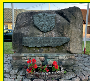
Rynek w Sulmierzyczach