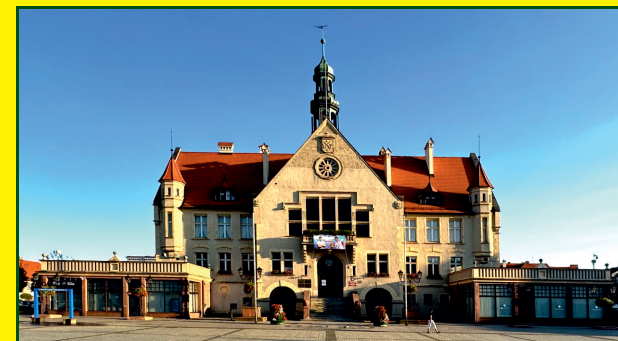
Ratusz w Krotoszynie

Przechodzimy obok kościoła pw. św. Piotra i Pawła, muzeum (też punkt IT na parterze), skręcamy w ul. Rynkową i wchodzimy na Rynek (1,3 km), skąd ul. Farną w kierunku wsch. a następnie al. Powstańców Wlkp. dochodzimy do ul. Ostrowskiej, na której skręcamy w prawo i idziemy aż do stacji benzynowej (2,7 km), gdzie skręcamy w prawo w ul. Chwaliszewską.