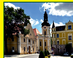
Kościół pw. św. Piotra i Pawła