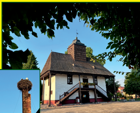
Ratusz w Sulmierzyczach

Mijamy pola, łąki oraz laski i po ok. 1 km docieramy do brukowanej drogi, która prowadzi do Granowic, przedmieścia Sulmierzyc (15,7 km). Dochodzimy do ul. Krotoszyńskiej, skręcamy w lewo i docieramy do Błonia (16,6 km), następnie ul. Strzelecką osiągamy Rynek (17,4 km).